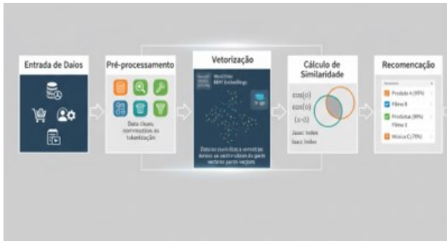
Figura 2: Interface do modelo de recomendação.

O diagrama do modelo de recomendação (Figura 2) detalha o fluxo de processamento: (Segue a descrição das etapas do diagrama: Entrada de dados → Pré-processamento → Vectorização → Cálculo de similaridade → Recomendação ).